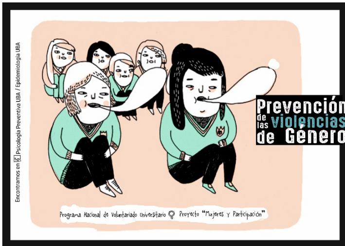
Imagen 4. Diseño de material elaborado para socializar talleres de prevención de las violencias de género.

A continuación compartimos tres talleres para trabajar con diferentes grupos en la problematización de las situaciones naturalizadas de violencias de género, la reflexividad sobre las propias experiencias y el fortalecimiento comunitario para el reconocimiento y la acción de exigibilidad de derechos.