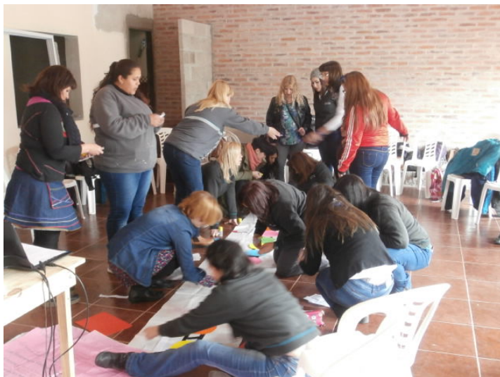
Imagen 2. Taller de cartografía de recursos frente a las violencias de género