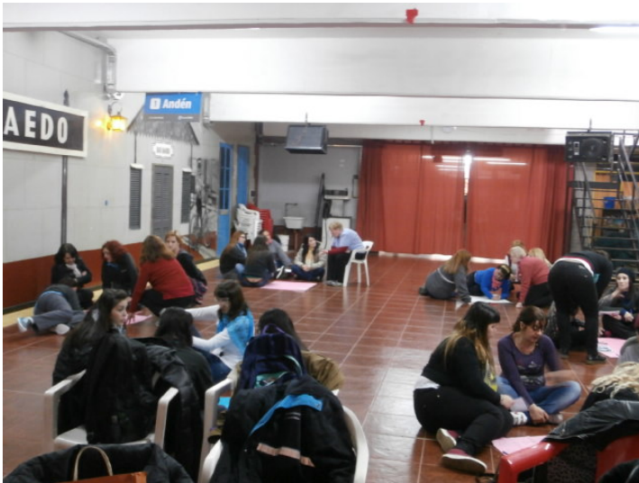
Imagen 1. Taller de problematización de las situaciones de violencia de género en el espacio del trabajo.

Nosotros no podemos salir de la barrera ni para ir al baño, o sea, para nada. Entonces para las compañeras eso es mucho más complejo, vos ponele se te enferma tu hijo, yo no tengo hijos, pero la mayoría de mis compañeras sí, y te llaman porque está enfermo tu hijo, no te dejan salir de la barrera, es así. Y eso en las otras áreas no pasa. Entonces a mí sí me gusta seguir en este rubro dentro del ferrocarril, aunque sé que es una vida mucho más sacrificada.